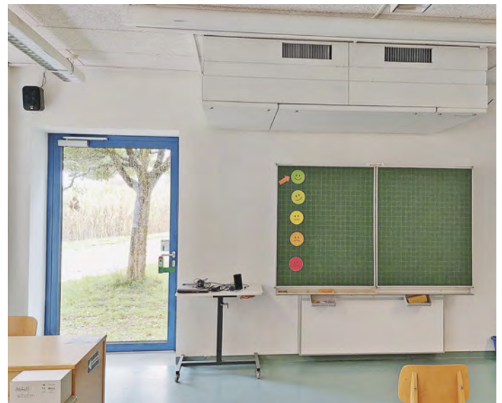
Beispiel Werkraum im Untergeschoss: Neue Fluchttüre ins Freie (links) und dezentrales Lüftungsgerät mit Wärmerückgewinnung an der Decke über der Tafel

werden. An einer Stelle muss jedoch wegen unvorhersehbaren statischen Schwierigkeiten noch eine Nacharbeit erfolgen, wobei das Problem bereits in Lösung ist. Mein großer Dank geht an alle an den Umbauarbeiten Beteiligten – von der Planung, über die Unterstützung durch den VG-Bauhof, die termin-treu ausführenden Firmen, bis hin zu den umfangreichen Reinigungsarbeiten kurz vor Schulbeginn ist trotz Urlaubszeit alles Hand in Hand und reibungslos gelaufen. Gemeinderat und Bürgermeister freuen sich über ein Plus an Sicherheit, Luftqualität und Energieeinsparung in unserem Schulgebäude in Schröding.