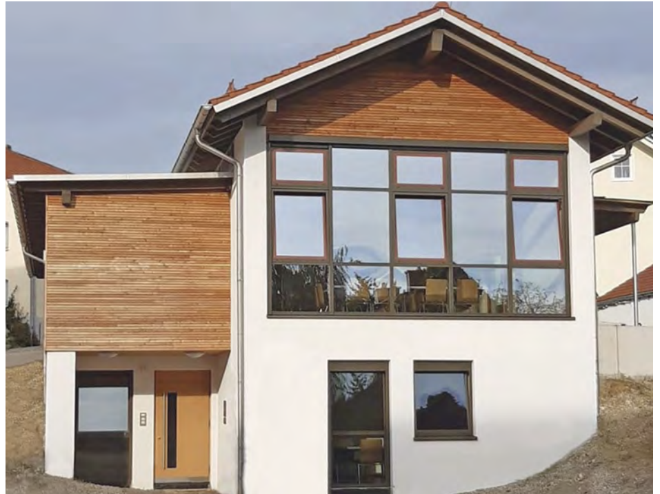
Korbinian-Aigner-Haus (Neues Gemeinschaftshaus Hohenpolding)

Hauptverwaltung 08084/94875-10 poststelle@vg-steinkirchen.de