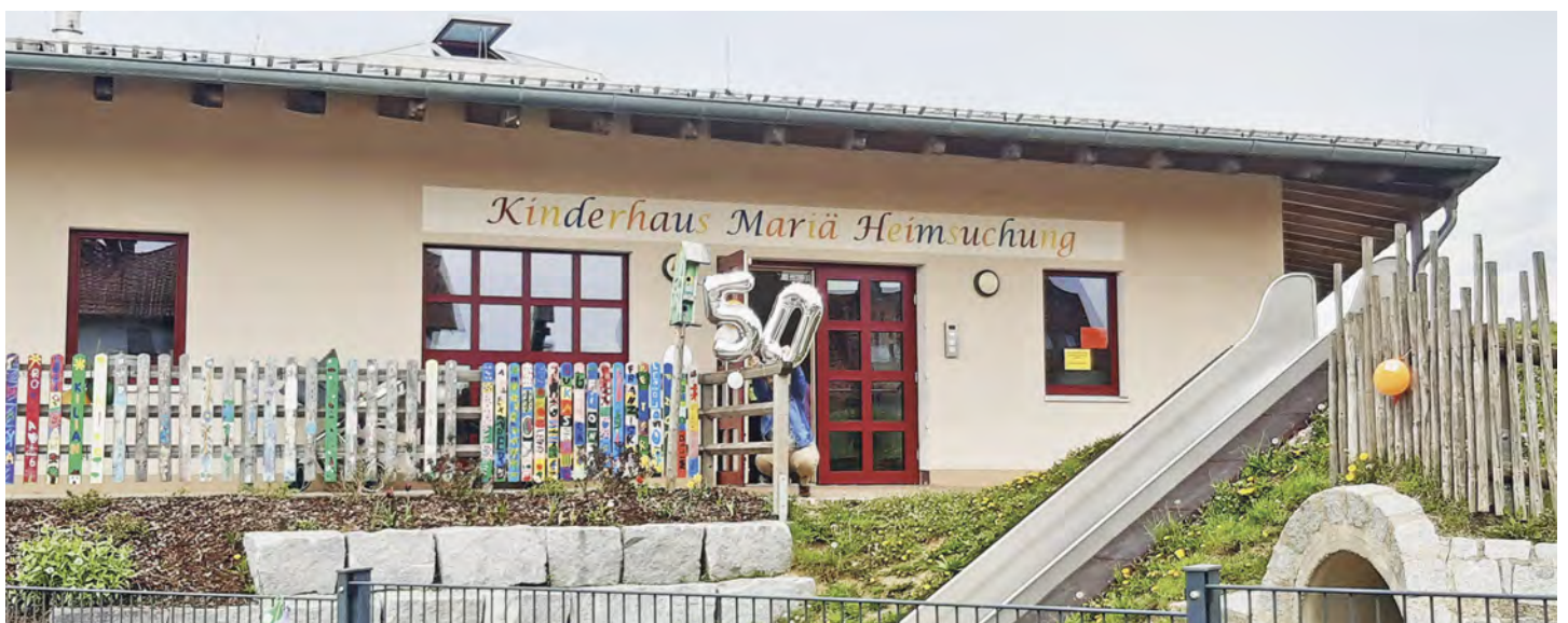
50 Jahre Kinderhaus Mariä Heimsuchung