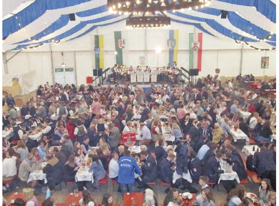
Holzlandvolksfest 2018 in Hohenpolding

Hauptverwaltung 08084/94875-10 poststelle@vg-steinkirchen.de